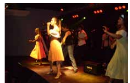
Na noite de quinta os congressistas assistiram ao concorrido show de Gian & Giovanni. Na sexta, a animação da noite ficou por conta da Banda Apocalipse