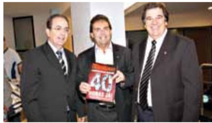
A revista Repórter Fecomercários circulou com a matéria pelas 40 Horas semanais de trabalho na capa. A publicação colaborou para orientar as deliberações