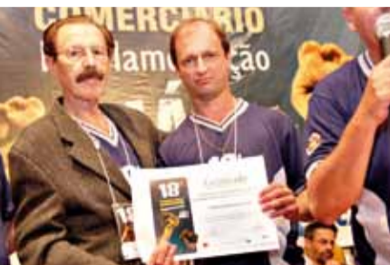
Orgulhosos e com a sensação de dever cumprido os Sindicatos Filiados receberam os certificados de participação