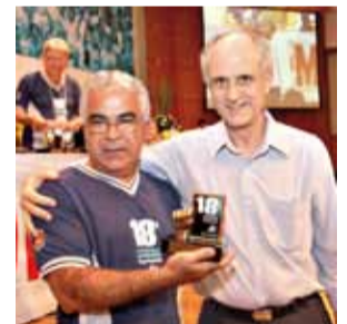
São Paulo, Jaú e São José dos Campos conquistaram, respectivamente, os troféus de Ouro, Prata e Bronze por terem levado as maiores delegações. Cada Sindicato contou com uma entusiasmada e festiva torcida