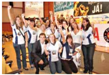
As mulheres marcaram presença no 18º Congresso. Tiveram participação ativa e positiva. Bom sinal, porque são elas que ocupam a maioria dos postos de trabalho no comércio