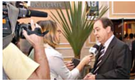
A abertura já anunciava a abrangência e a relevância do Congresso. A mídia da baixada santista fez uma ampla cobertura que garantiu sua visibilidade

O Centro de Lazer dos Comerciários do Estado de São Paulo (ex-Colônia), em Praia Grande, está sendo considerado o reduto das reivindicações comerciárias. A redação da Carta de Praia Grande (ver capa) no encerramento do 18º Congresso Sindical Comerciário comprova esta tradição iniciada em 1990. De 17 a 19 de setembro de 2009, o auditório do Centro foi uma tribuna de importantes pronunciamentos, conagraçamentos e reafirmação de que a unidade dos 65 Sindicatos Filiados fez a grandeza do 18º Congresso. As imagens a seguir comprovam esta união, confraternização decisiva participação da categoria no evento.