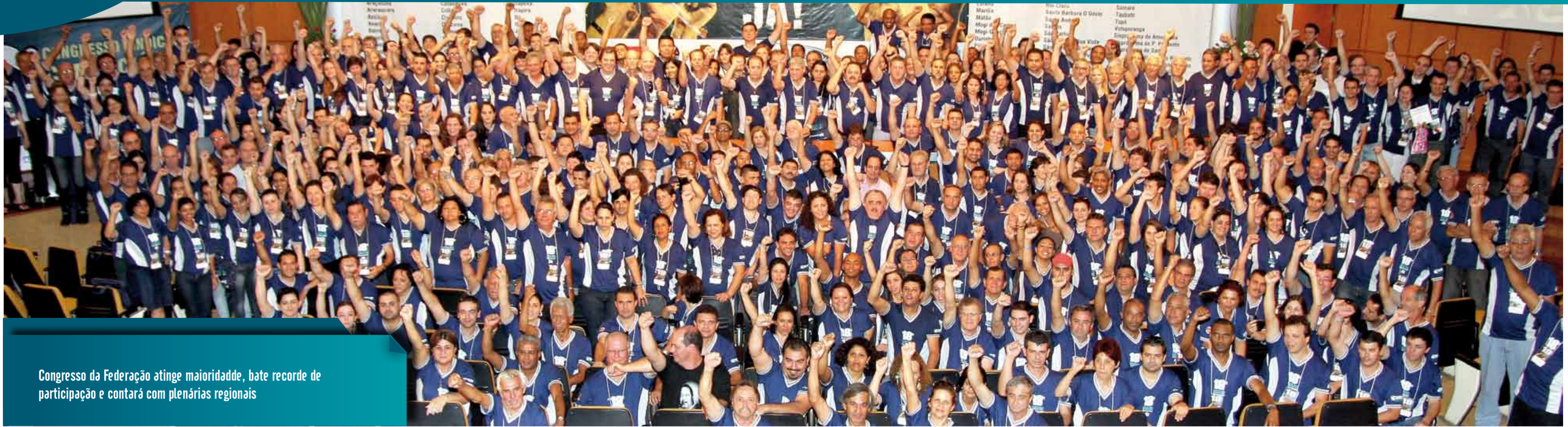
Congresso da Federação atinge maioridade, bate recorde de participação e contará com plenárias regionais